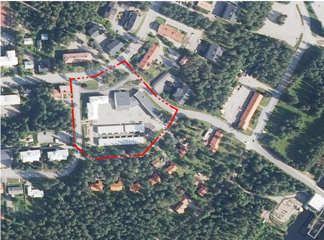
Suunnittelualueen alustava rajaus. (Ortokuva MML Paikkatietoikkuna).

Asemakaavamuutoksen tavoitteena on mahdollistaa Alvarin korttelin täydentäminen asuinrakennuksilla. Alustavasti uudisrakennusten on ajateltu sijoittuvan purettavan koulurakennuksen paikalle. Asemakaavassa tutkitaan asuinrakennusten sijoittumista ja mittakaavaa alueen ominaispiirteet ja maisemakuva huomioiden. Suunnittelussa huomioidaan sekä säilyvän koulurakennuksen että uusien asuinrakennusten pysäköintitarpeet.